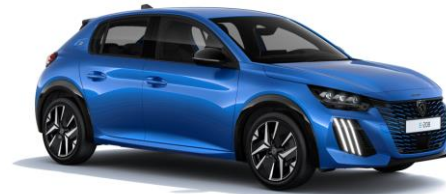
Vertigo Blau M6SM - Option