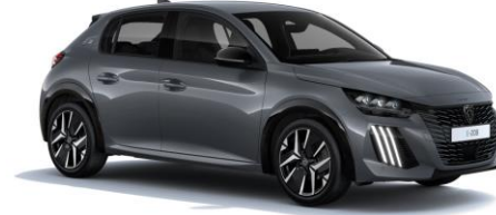
Selenium Grau M0LD - Teinte gratuite