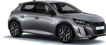
Artense Grau M0F4 - Option