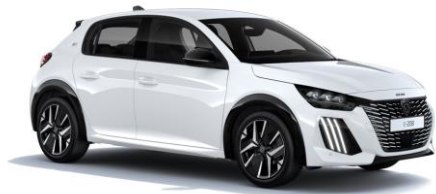
Okenite Weiß M0SU - Option