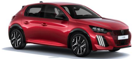
Elixir Rot M5VH – Option