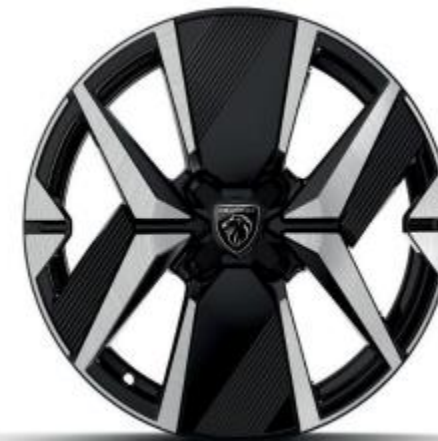
16" Leichtmetallfelge YANAKA